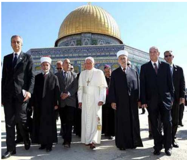
Фотография папы с представителями палестинцев перед мечетью Омара на Храмовой горе.