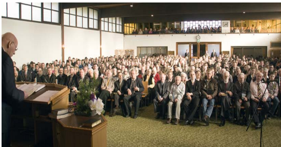
Фотоснимок от 5 Центре Мисии города